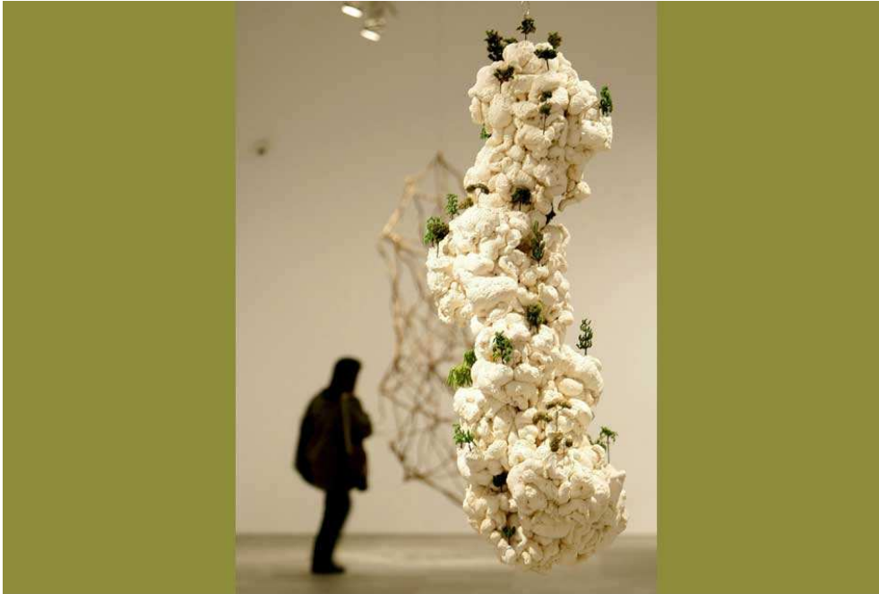
"Trees" by León Ferrari is on view at the Museo Nacional Centro de Artes Reina Sofía in Madrid.