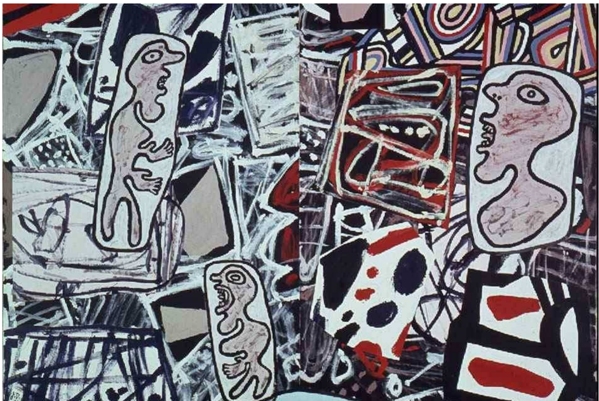
Jean Dubuffet - "Mnemo-technique III", 1977. Oil on canvas, 40 x 55 inches - Private Collection

http://www.monografias.com/trabajos10/desartp/desartp.shtml