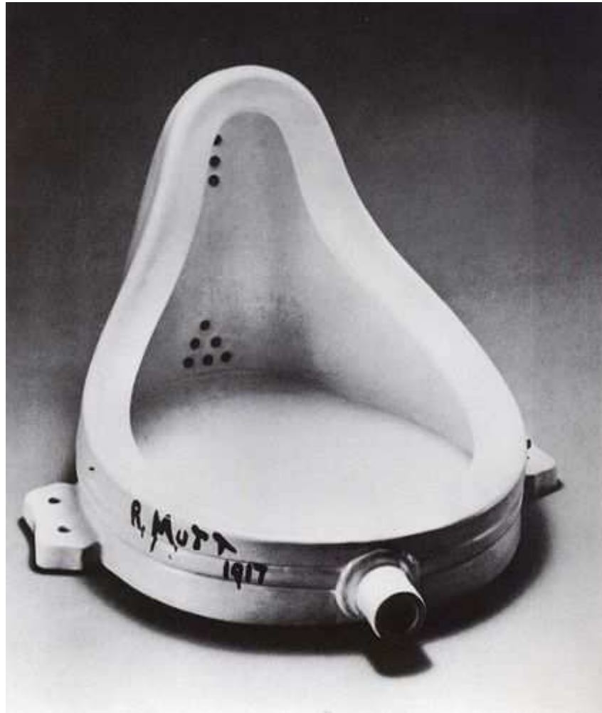
Marcel Duchamp "L'urinoir", 1916-17