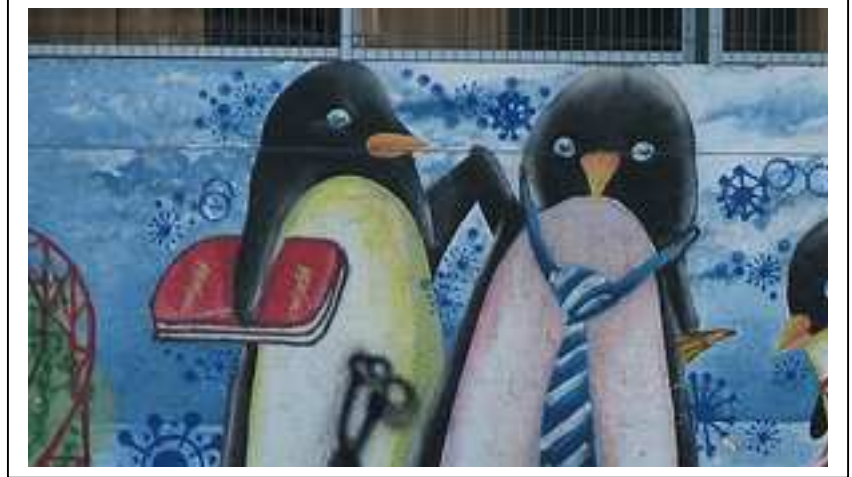
Mural en un colegio de “pingüinos” en

Me gustan los estudiantes porque son la levadura del pan que saldrá del horno con toda su sabrosura, para la boca del pobre que come con amargura. Caramba y zamba la cosa ¡viva la literatura!