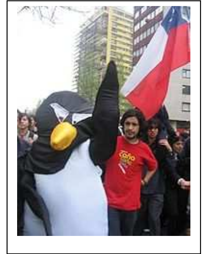
Manifestante disfrazado de pingüino

Hace tres semanas que comenzó una huelga en la enseñanza secundaria, y esta semana unos 800.000 jóvenes paralizaron sus actividades y se manifestaron en el país en la peor crisis estudiantil en más de tres décadas y en el momento más complejo para el joven Gobierno de la presidenta Michelle Bachelet.